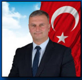
NECİP TOPUZ KARATAŞ BELEDİYE BAŞKANI