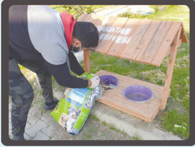
Sokak Hayvanları Bakım ve Besleme Hizmetleri