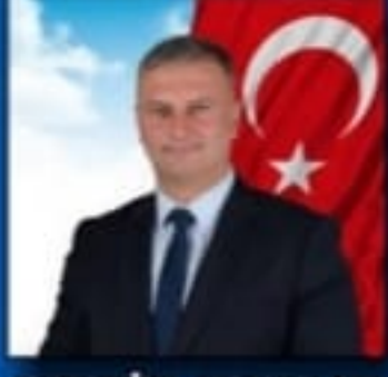
NECİP TOPUZ KARATAŞ BELEDİYE BAŞKANI